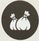
التخلص من النفايات