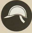
واقية الرأس (قبعة السلامة)