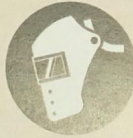
الخطارات الواقية وحامية الوجه