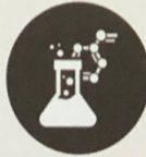
تفاعل مواد كيميائية